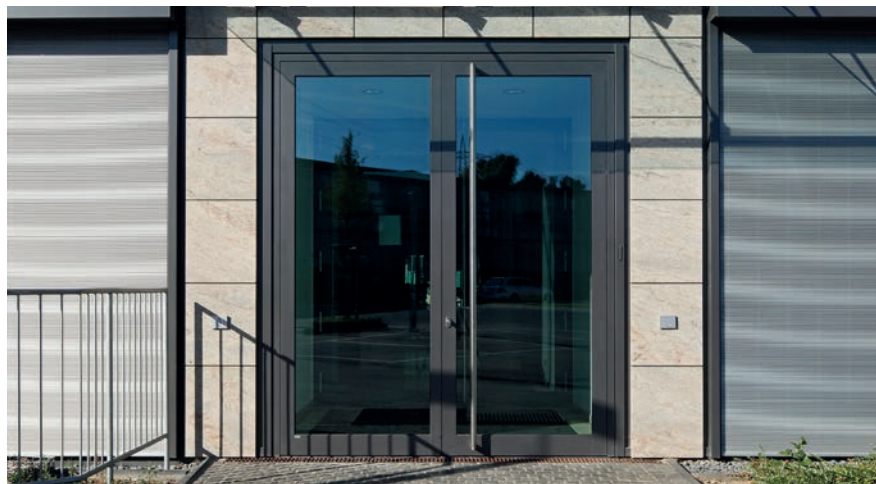
Schüco Porte ADS 75 HD.II Schüco Door ADS 75 HD.II