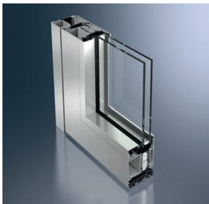
Schüco ADS 75 HD.II Schüco ADS 75 HD.II

With its elegant flush cover plates and invisible hinges, the ADS 75 HD.II is now available in a new version up to 3 m design.